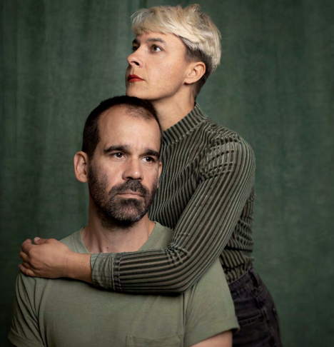
© Lucie Pastureau & Lionel Pralus

Église Saint-Germain – 7 Place Saint-Germain à Aix-Noulette